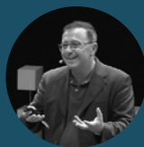
Grammenos Mastrojeni Segretario Generale aggiunto dell'Unione per il Mediterraneo